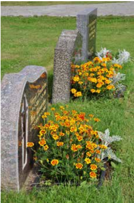
Eksempel på graver som stelles av Nes kirkekontor

Prisen for stell er kr 850.-. Når det gjelder stell over flere år, må det inngås en avtale på minst fem år, og på minst kr 5 000.-. Årlig kostnad for planting er da den samme, kr 850.-. Det blir plantet i tre omganger gjennom sommeren, og vannet og luket.