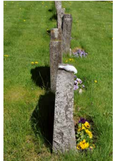
Her ser man et par gravminner ute av geledd, disse må undersøkes nærmere