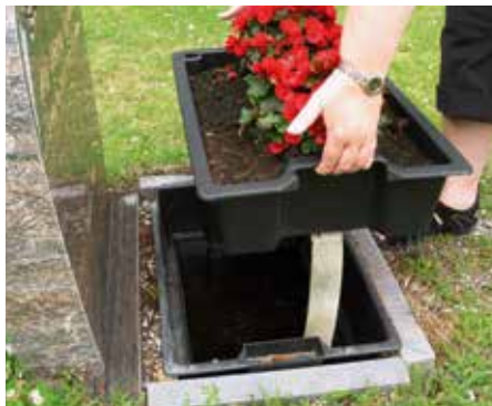
Her ser man prinsippet for en plantekasse: Løft opp kassa med jord og blomster og vanningskaret ligger under.

Med en plantekasse slipper du å tenke på vanning av blomster hver dag når det er varmt! Plantekassa holder jorda fuktig til en hver tid. Du må bare fylle på vann ca hver 3. uke, og kassa må ikke tømmes før vinteren. En plantekasse koster kr 1 100.-, ferdig nedsatt og fylt med jord.