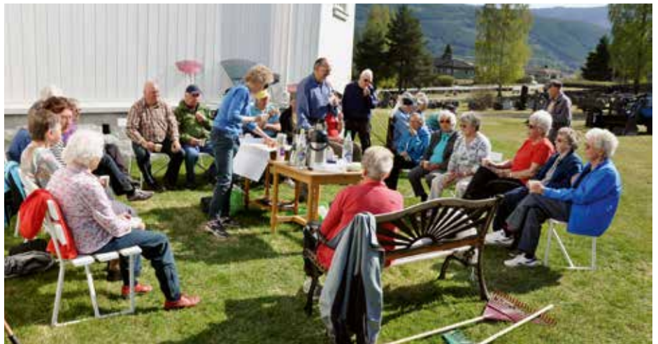
Etter en god dugnadsøkt serveres det kaffe og kringle.